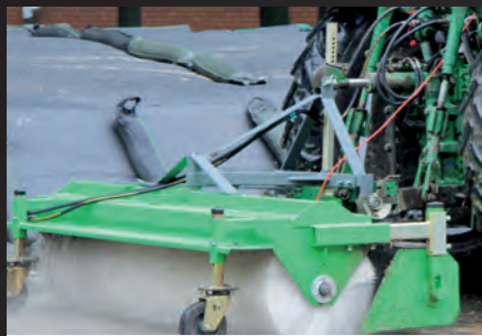
bema Agrar am Schlepper mit Anbau Dreipunkt Heck.