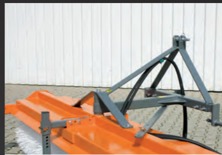
bema 20 freikehend mit Dreipunkt-anbau.