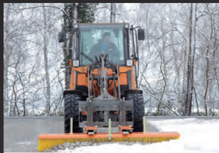
bema 11 Multi-Clean im Schnee-einsatz.