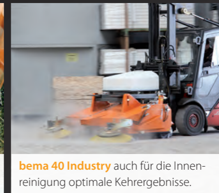
bema 40 Industry auch für die Innenreinigung optimale Kehrergebnisse.