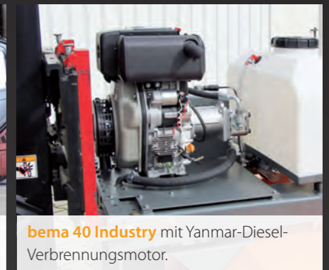
bema 40 Industry mit Yanmar-Dieselmotor.